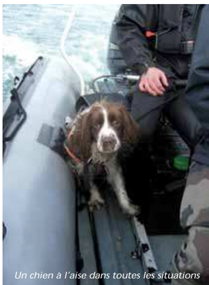
Un chien à l'aise dans toutes les situations

Le retour d'expérience et la diversification des missions de cynotechnie spécialisées donnent l'opportunité à la marine d'acquérir des chiens de race aux caractéristiques physiques atypiques et aux performances accrues, en particulier dans les domaines de l'aide à la recherche de stupéfiants et d'explosifs.