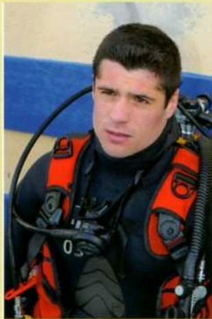
Ce stage permet de mieux se connaître, de dépasser ses limites