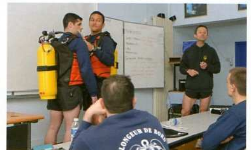
Tableau blanc et attention de rigueur à l'école de plongée

rappels stigmatisants en physique. Bientôt, barotraumatismes, foramen ovale, trompes d'Eustache, lois de Boyle-Mariotte, de Charles ou de Dalton n'ont plus de secrets pour cette classe bigarrée composée d'élèves attentifs ou dubitatifs, à qui les cours de physiologie n'ont même pas donné froid dans le dos.