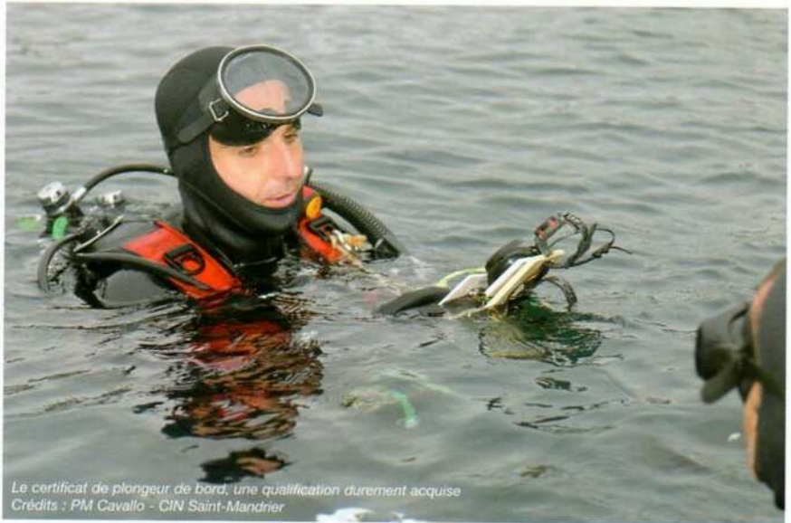
Le certificat de plongeur de bord, une qualification durement acquise

Les plongeurs de bord, au-delà de leurs fonctions respectives et originelles, qu'ils soient matelots, officiers marinières ou officiers, contribuent à l'autonomie de leur unité, en garantissant une capacité d'intervention subaquatique 24h sur 24, 7 jours sur 7. Ils sont titulaires d'un certificat qui est loin d'être une formalité et qui sanctionne la réussite à un stage difficile. Ils ne méritent pas d'être affublés des sobriquets inventés par leurs congénères plus jaloux que de bonne foi, car le jour où un bout se coincera dans l'hélice, ça sera certainement de nuit, avec des conditions météo dégradées et au vent d'une côte proche.