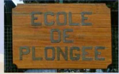
L'école de plongée, éloge à la sobriété et à la discipline

Depuis sa création, l'école de plongée a formé plus de 12 000 plongeurs de diverses catégories, dont 1800 actuellement en service dans la marine. Chaque année, 700 stagiaires en franchissent la coupée.