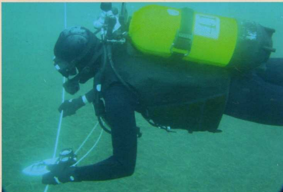
Recherche circulaire : une illustration parfaite de la méthodologie enseignée au cours PLB

Six sessions, accueillant chacune environ une trentaine d'élèves, sont programmées annuellement. Le taux de réussite variant de 70 à 80%, une bonne préparation physique et aquatique des candidats est indispensable. A l'issue du stage de plongeur de bord, les élèves sont capables de travailler en plongée, en autonomie et en sécurité, de jour comme de nuit, à une profondeur maximale de 35 mètres.