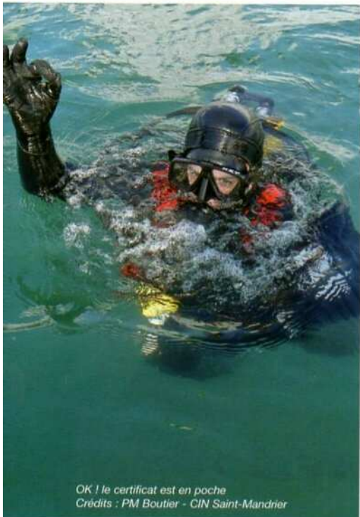
OK ! le certificat est en poche

Qu'ils aient réussi ou aient quitté la formation en cours, tous admettent qu'ils ne regrettent pas les jours passés à l'école de plongée, occasion de découvrir ses limites et bien souvent de les dépasser.