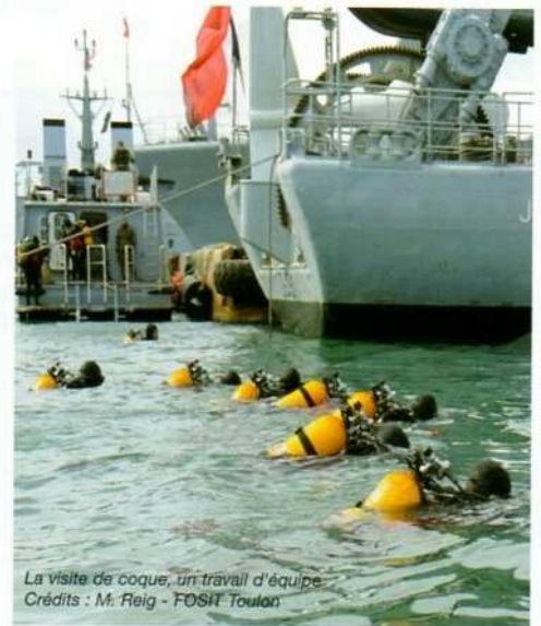
La visite de coque, un travail d'équipe

Vous l'aurez compris, par nature et par finalité, la plongée militaire est quelque part une plongée du 3 ème type, pas vraiment loisir et plus que professionnelle. Elle rassemble des géné-